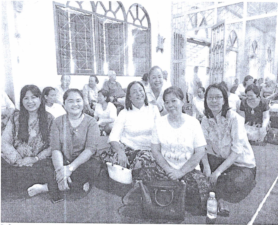
ร่วมพิธีทางศาสนา